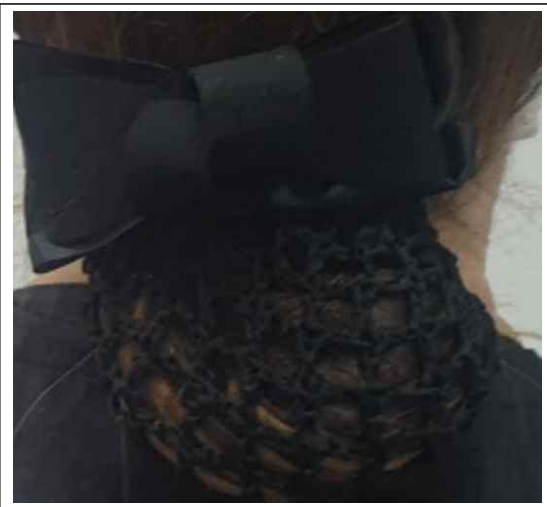
(사진설명) 머리핀 - 나비모양