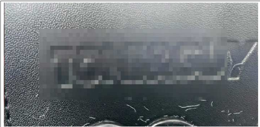
(사진설명) 몸에 착용하는 가위집 - 상표 노출