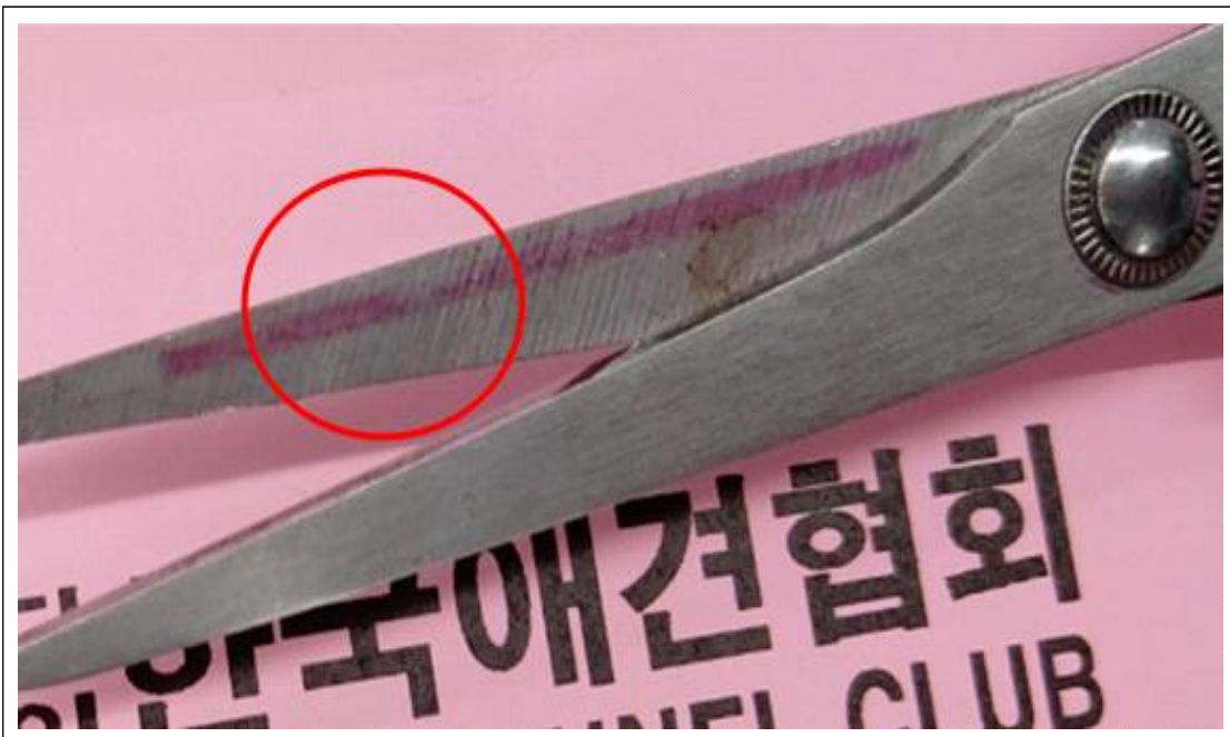
(사진설명) 가위 - 가위 날에 색상 표시