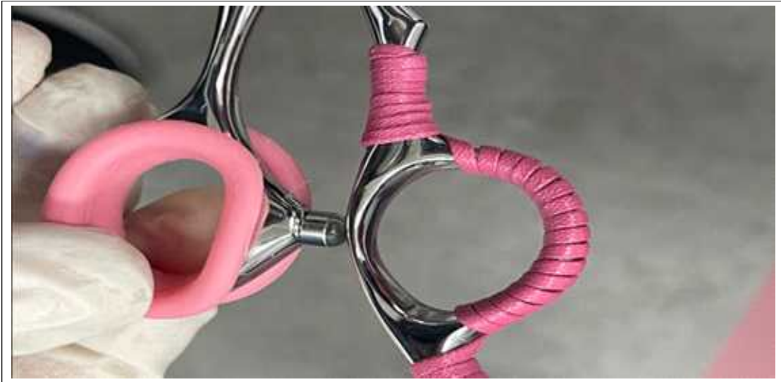
(사진 설명) 가위 - 스트랩 (고무링만 허용)