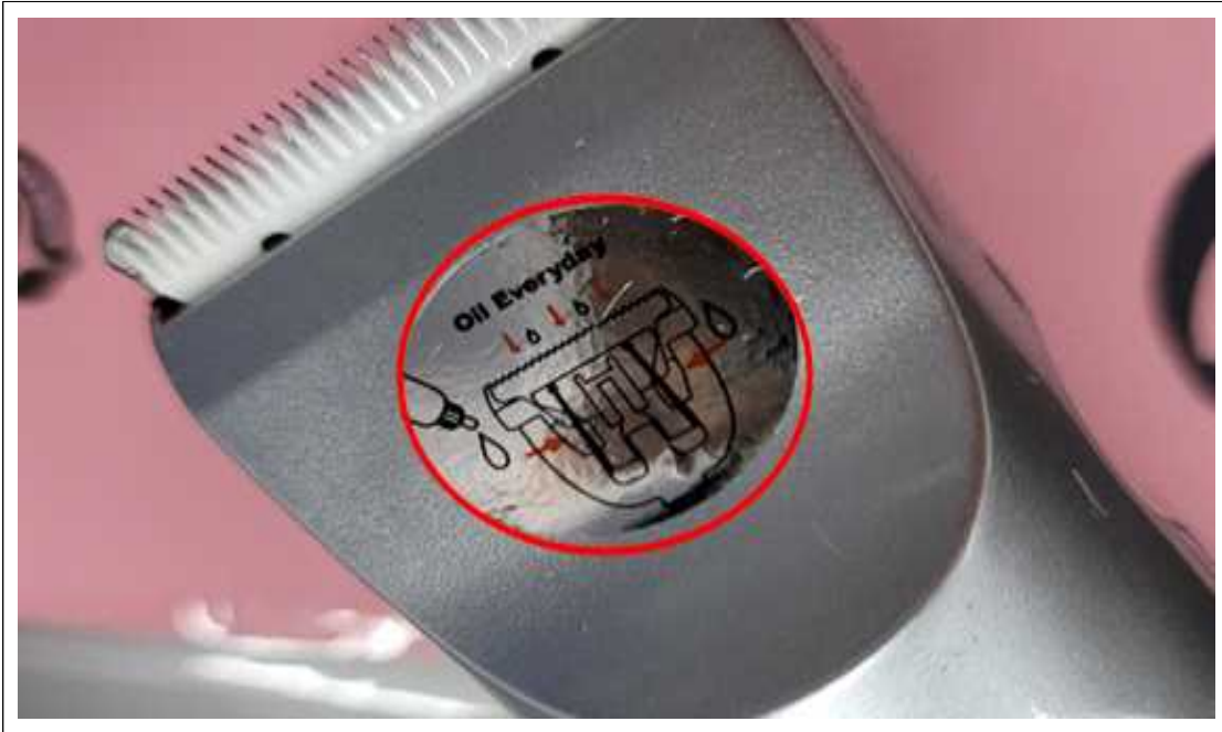
(사진설명) 클리퍼 - 부착물(스티커) 미제거