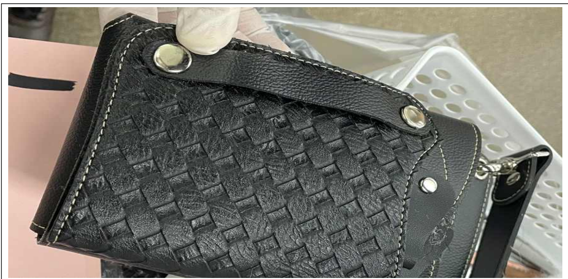
(사진설명) 몸에 착용하는 가위집 - 무늬