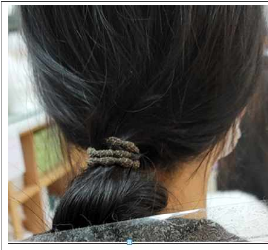
(사진설명) 머리끈 - 갈색