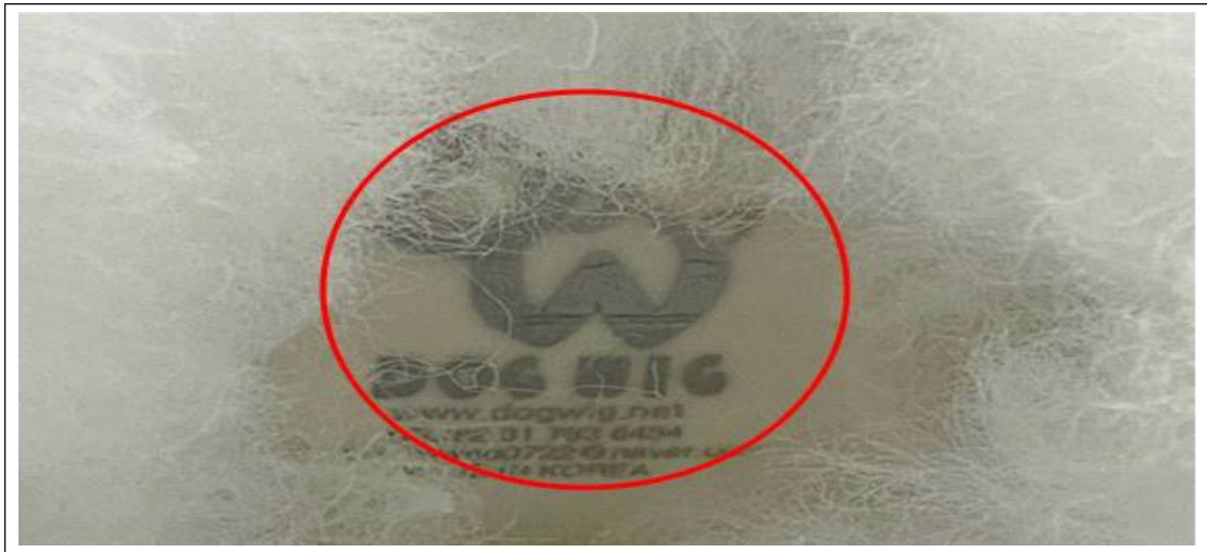
(사진설명) 견체 - 상표 노출