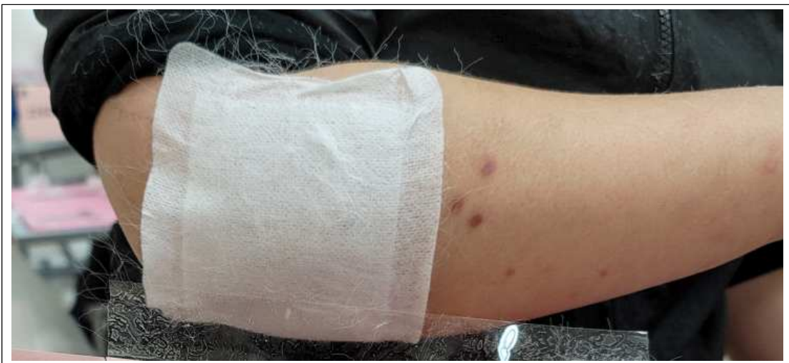
(사진설명) 밴드 - 살색이 아님