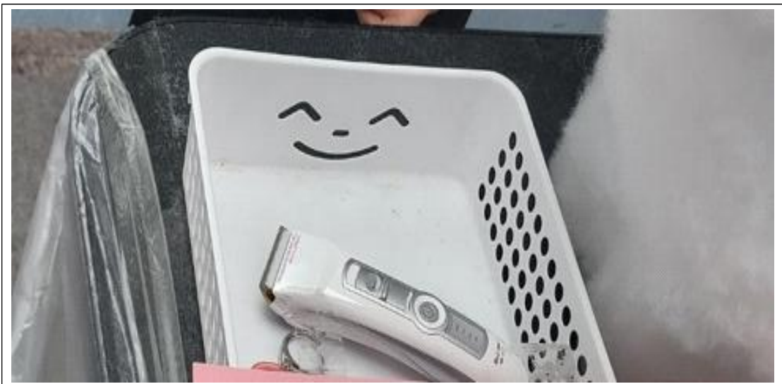
(사진설명) 바구니 - 무늬가 있음